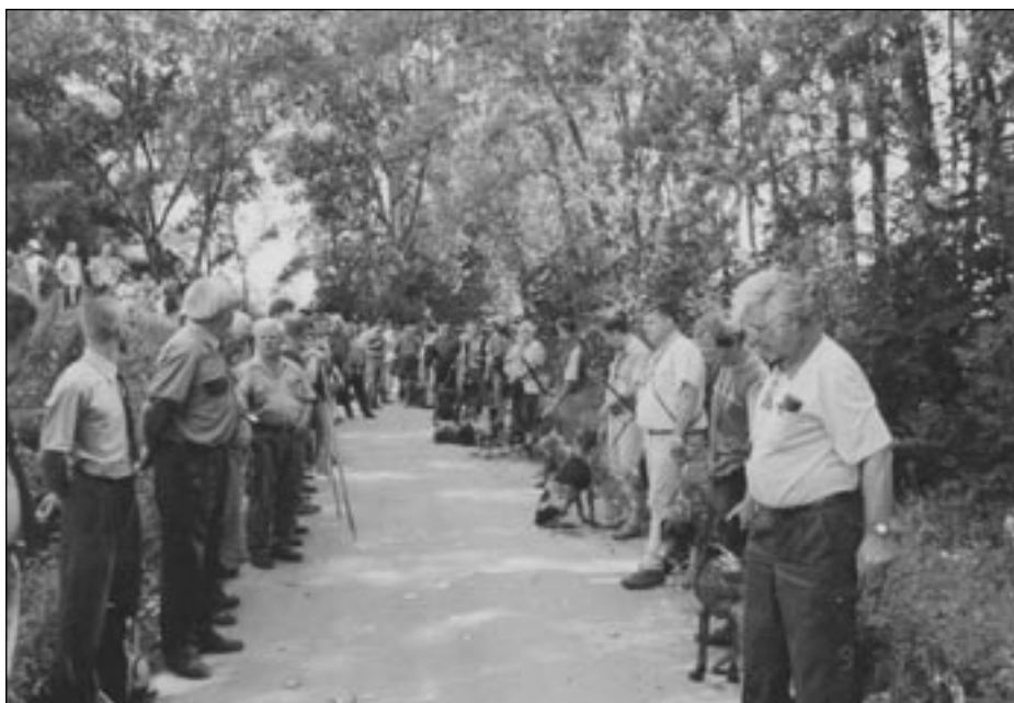
Nástup vodičov na vodnú prácu - Skúšky k 10. výročiu KCH NKS, Dolná Krupá.