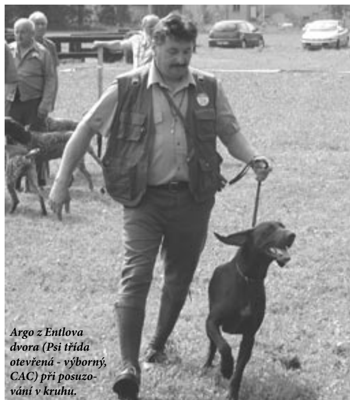
Argo z Entlova dvora (Psi třída otevřená - výborný, CAC) při posuzování v kruhu.