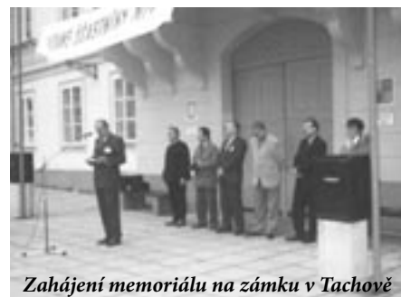
Zahájení memoriálu na zámku v Tachově